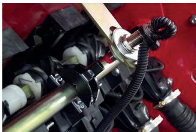
Рисунок 6 – Датчик положення штока актуатора

систему контролю висіву необхідно налаштувати на потрібні параметри (норму висіву, культуру, технологічну колію, номер поля та ін.), після чого агрегат може починати виконувати процес сівби.