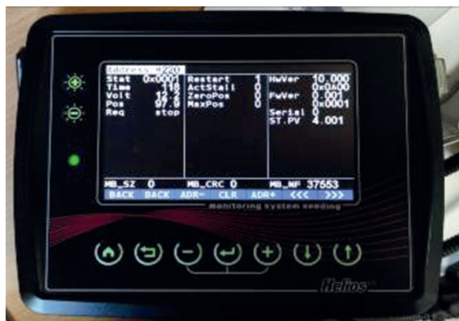
Рисунок 2 – Панель оператора