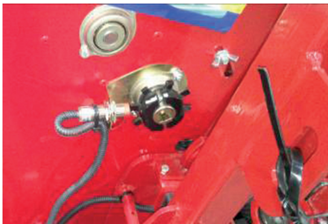
Рисунок 4 – Датчик контролю обертання вала дозатора

Датчик контролю обертання вала дозатора (рис. 4) встановлюється на кронштейн, який кріпиться на боковині бункера сівалки.