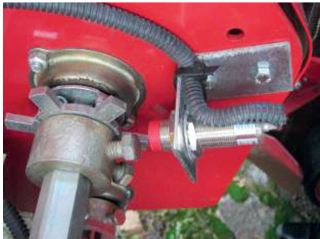
Рисунок 3 – Датчик швидкості