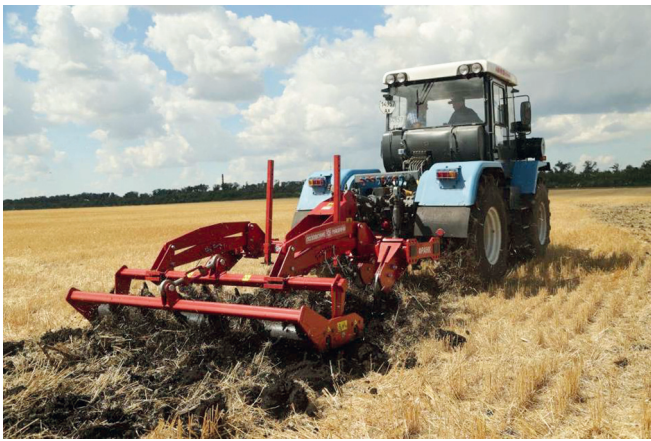
Рисунок 1 – Ґрунтообробний агрегат ХТЗ-17221 + глибокорозпушувач ГРУ-2,5 в роботі

вищеною силою тяги і зниженою швидкістю руху.