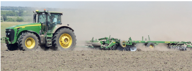
Рисунок 3 – Загальний вигляд ґрунтообробного агрегата John Deere 8430 + John Deere 637

Процес руху МТА під час виконання технологічного процесу складається з трьох фаз: розгін, несталий рух, гальмування (рис. 3, 4) [Лебедев А. Т., Артёмов М. П., 2013].