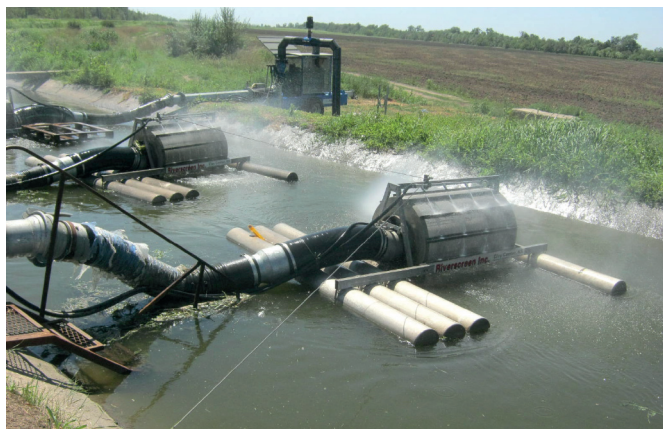
Рисунок 4 – Водозабірні пристрої насосних станцій з фільтрами активного типу