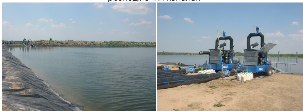
Рисунок 3 – Робота групи дизельних насосних станцій на басейні-накопичувачі

Коли зрошують великі сівозмінні площі, які знаходяться на різній відстані від джерела води і мають різну конфігурацію, створюють басейни (рис. 3) як джерело води для накопичування відповідного об'єму (залежно від площі та режиму зрошення, витратних характеристик дощувальних машин).