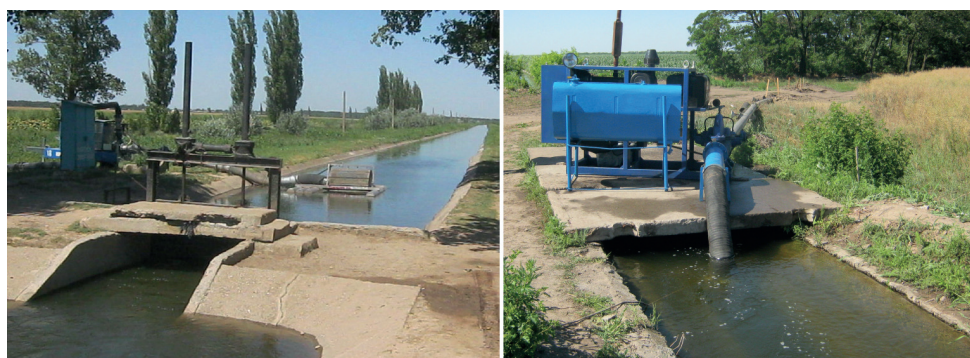
Рисунок 2 – Варіанти розташування насосних станцій на розподільчих каналах

У випадку розташування зрошувальної ділянки в зоні дії розподільчого каналу застосовується проста схема: біля каналу встановлюється пересувна насосна станція (рис. 2), від напірної лінії якої монтується трубопровід подачі води до дощувальної машини.