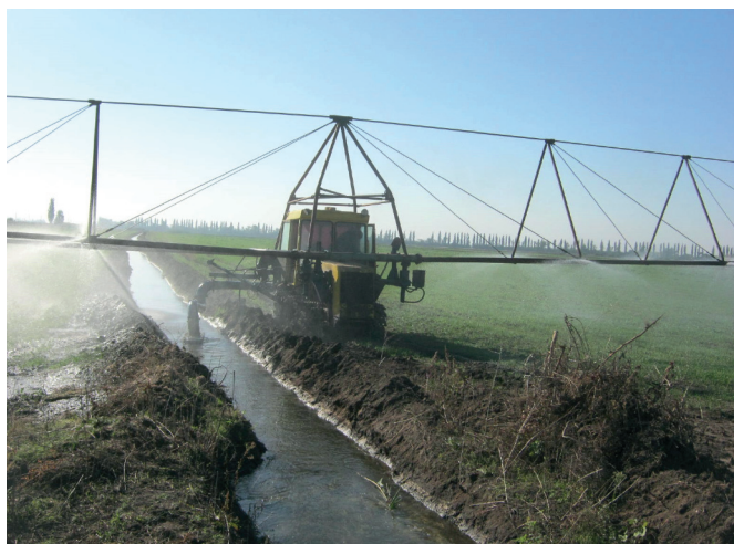
Рисунок 1 - Дощувальний агрегат ДДА-100М в роботі

Для застосування та експлуатації дощувальних агрегатів ДДА-100М (рис.1) використовуються відкриті зрошувальні мережі, які складаються з розподільчої мережі та тимчасових зрошувачів у земляному руслі (мережі живлення), які нарізуються на зрошувальному масиві за певною схемою.