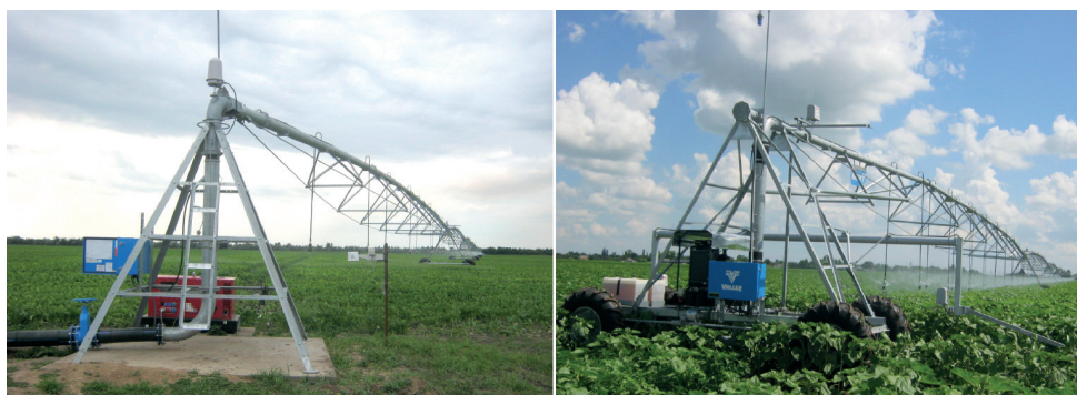
Рисунок 6 – Багатоопорні дощувальні машини марки Valley (А - кругової дії, Б - фронтальної дії)

Задача «вписування» широкозахватних машин (захват 300-800 м) в контури полів, які поливалися дощувальним агрегатом ДДА (захват 120 м) нерідко є досить складною і докорінно відрізняється від проектно-планувальних рішень зрошення в зоні Каховського каналу.