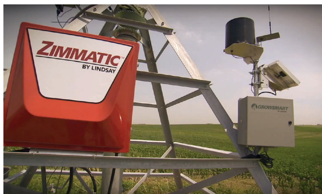
Рисунок 8 – Метеостанція Growsmart у складі дощувальної машини

показників проводився на середню сезонну площу обслуговування 100 га, яку забезпечує дощувальний агрегат ДДА-100М.