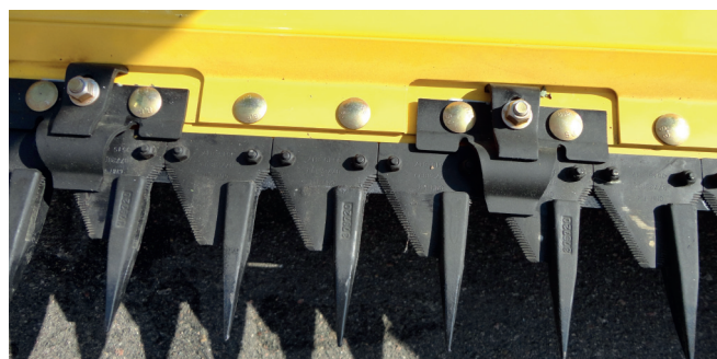
Рисунок 5 – Класичний сегментно-пальцевий різальний апарат

Конструкційне виконання різального органа (ножа/сегмента) – геометрич-