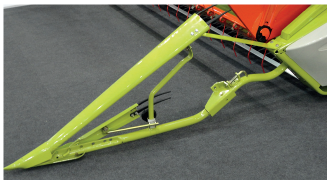
Рисунок 3 – Лівий польовий дільник хлібної маси

металевими або пластиковими граблинами, встановлене на підтримках, призначається для підведення стебел культури до різального апарата, утримання їх в момент зрізання і подачі до шнека. Привід мотовила здійснюється через ланцюгову передачу гідродвигуном або механічним варіатором. Пальці граблин виготовлені зі сталі або пластмаси.