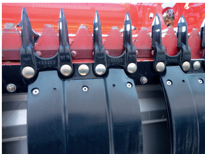
Рисунок 7 – Гнучкі копіювальні щитки днища жатки Flex

Жатки серії MF Activa (компанія «New Holland») мають систему автоматичного вирівнювання Autolevel, яка дозволяє копіювати контури поверхні поля до 8 % та забезпечити оптимальну в таких умовах робочу швидкість і продуктивність комбайна незалежно від ландшафтних умов. Система контролю висоти зрізу Terra Control забезпечує два режими по висоті зрізу: 8-15 см для низьких зернових колосових і зернобобових культур і 10-50 см для довгостеблих культур.