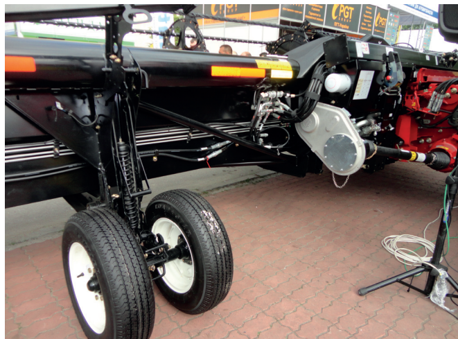
Рисунок 2 – Ходова система зернової жатки (компанія «Мак – Дон»)

Платформа жатки визначає ряд технічних і технологічних характеристик, які пов'язані з параметрами інших її систем. Збільшення ширини захвату до 11 метрів і дотримання прямолінійності площини різального апарата вирішується застосуванням цілком автономної ходової системи (рис. 2).