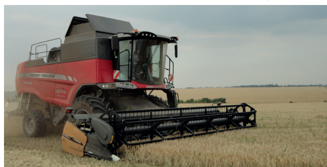
Рисунок 8 – Зернова жатка Challenger-670B складі комбайна 7370 PL BETA під час прямого комбайнування ячменю

Аналіз наявних технічних характеристик жаток не дає відповіді на ряд конкретних питань, які можна отримати в умовах експлуатації. Тому в сезон збирання хлібів в останні роки проведено експлуатаційні випробування та виконано оцінювання зернових жаток під час роботи в складі зернозбиральних комбайнів (рис. 8). Умови роботи (табл. 1) загалом були однотипними для всіх жаток і відповідали вимогам для задовільного виконання жатками технологічного процесу (табл. 2).