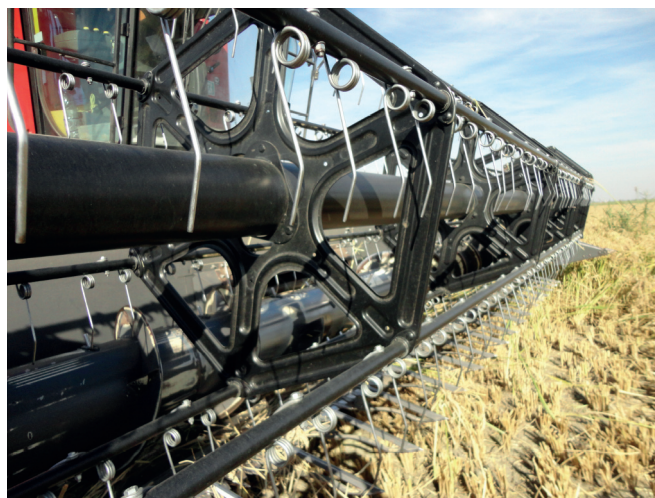
Рисунок 4 – Мотовило з центральною трубою, жорсткими дисками та металевими фігурними пальцями

металевими або пластиковими граблинами, встановлене на підтримках, призначається для підведення стебел культури до різального апарата, утримання їх в момент зрізання і подачі до шнека. Привід мотовила здійснюється через ланцюгову передачу гідродвигуном або механічним варіатором. Пальці граблин виготовлені зі сталі або пластмаси.