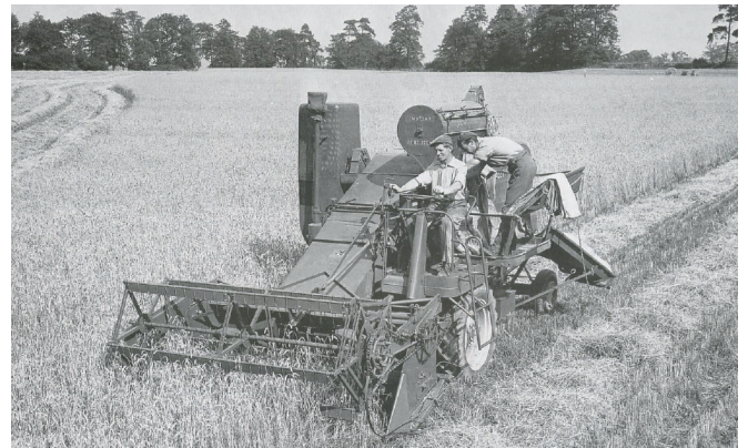
Рисунок 1 – Зернова жатка і комбайн I покоління в роботі

роках XX століття (рис. 1), має ширину захвату до 3 метрів, невисоку швидкість ножа різального апарата і подачу хлібної маси в комбайн до 3 кг/с.