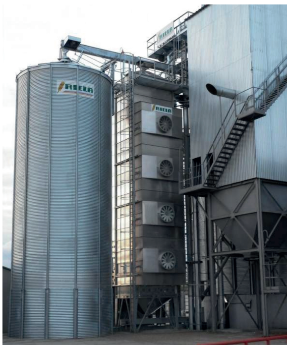
Рисунок 4 – Зерносушарка шахтного типу RIELA

Зерносушарки шахтного типу Monsun (Данія) (рис. 5) мають конструкційне виконання, яке забезпечує як швидкісні, так і щадні режими сушіння зернових культур. Проектна продуктивність сушіння зерна досягає 200 т/год. За один прохід зерносушарка здатна знизити вологість зерна кукурудзи з 40 до 15%. Крім традиційного зерна і насіння вона забезпечує високотехнологічне та разом з тим безпечне сушіння насіння олійних культур – ріпака та соняшнику.