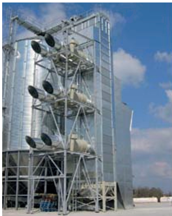
Рисунок 5 – Зерносушарка шахтного типу Monsun