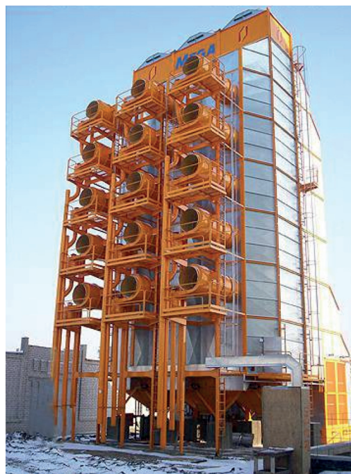
Рисунок 3 – Зернова сушарка шахтного типу MEGA

Зернові сушарки шахтного типу MEGA моделі серії TC (Аргентина) (рис. 3), завдяки установці кожного модуля на індивідуальну раму мають надміцну модульну структуру.