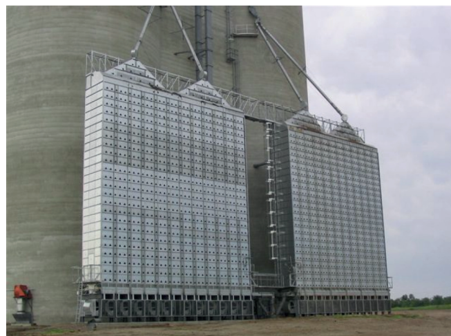
Рисунок 2 – Зерносушарка Grain Handler типу Cross-Flow

Зерносушарки Grain Handler (США) відзначаються двома поширеними типами – Cross-Flow (рис. 2), коли в процесі сушіння тепле повітря проходить перпендикулярно через рухоме зерно, і Mix-Flow, коли тепле повітря проходить у поздовньому напрямку через рухоми товщу зернового стовпа. У США тип Cross-Flow використовується в сушарках компаній Deluxe, GSI, Brock, MC, Sukup. Інша важлива особливість зерносушарок Grain Handler – можливість сушити будь-який вид зерна, починаючи від маку та гірчиці і закінчуючи квасолею, рисом і соняшниковим насінням без заміни пористого сита. Широкий діапазон температур і точні температурні режими – до 0,5°C забезпечують якісне сушіння не тільки зерна, але й насіннєвого матеріалу з продуктивністю від 10 до 190 т/год, залежно від вихідних показників вологості та виду продукції. Значна висота сушарки обумовлює рух зерна в її порожнині та тим самим нагрівання і сушіння впродовж тривалого часу. Це створює щадний режим сушіння і, як наслідок, зменшує частку розтрісканого зерна від впливу температури. Тра-