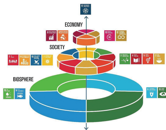
Рисунок 2 – Складові сталого розвитку свинарства