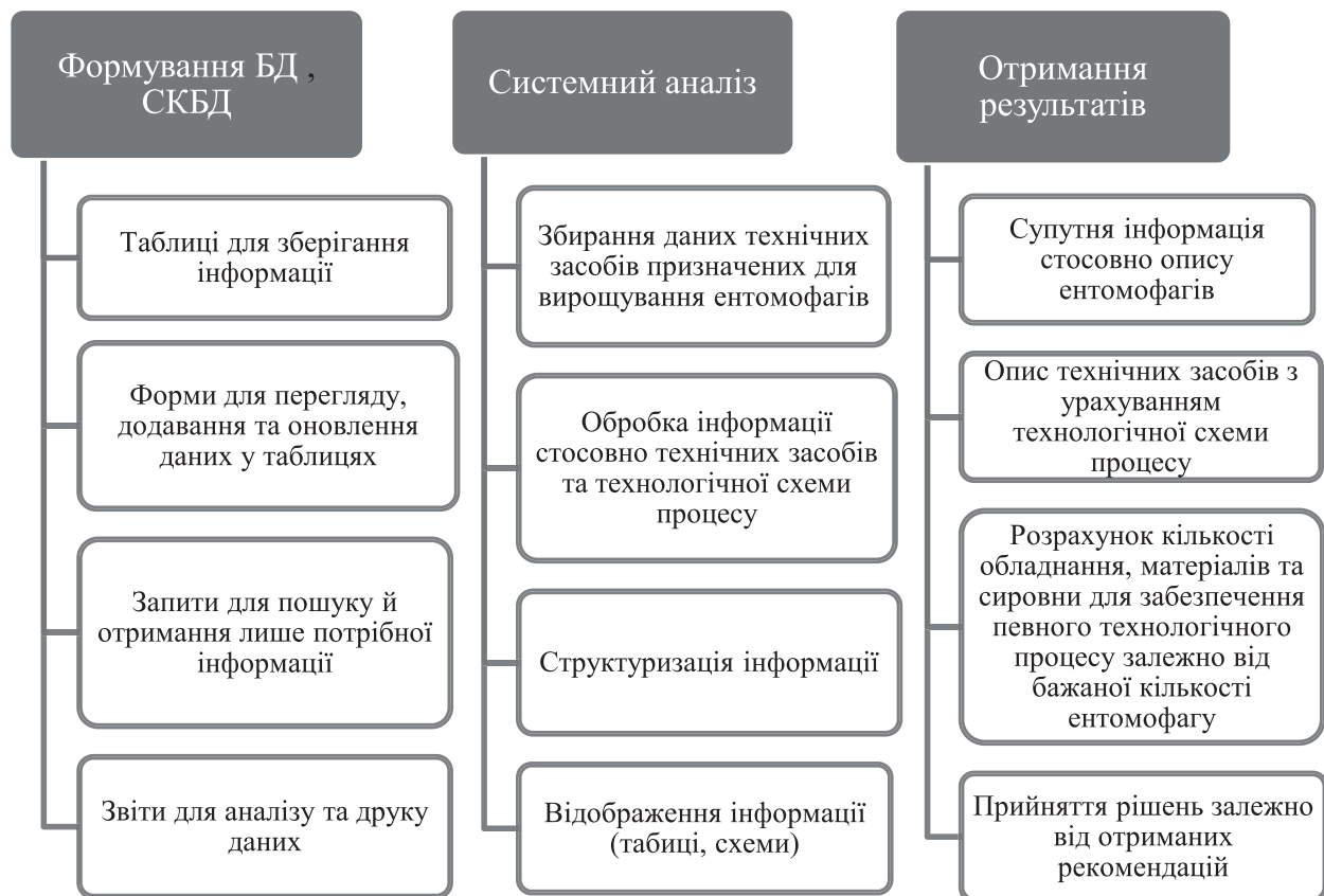
Рисунок 1 – Етапи функціонування БД

Під час проектування нових приміщень ентомологічного виробництва, технічному переозброєнні і реконструкції діючих біолабораторій і біофабрик, необ-