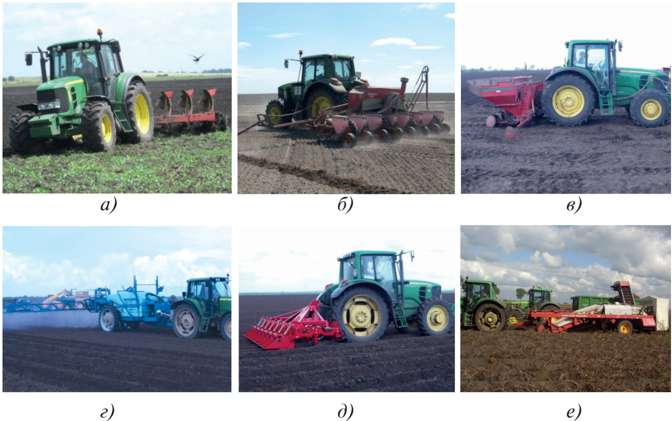
Рисунок 1 – МТА на базі трактора John Deere 6630

У період випробувань трактор експлуатувався з плугом обортовим RS 100, обприскувачем Маххог 40, культиватором-гребенеутворювачем GH 4500, просапною сівалкою Aeromat 8S, картоплексаджалкою UN 3100 і картоплекопачем-навантажувачем Clean Flow 2000 (рис.1).